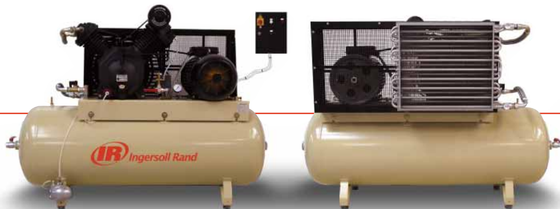
Gama Premium mostrada

Montado sobre depósito de 11 bar, montado sobre bancada de 14 bar.