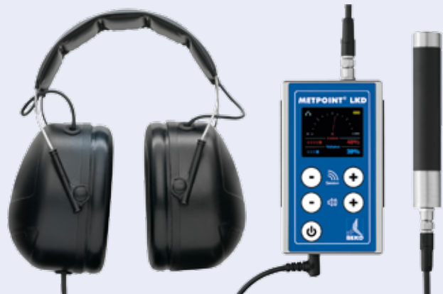
Ejemplos del producto extraídos de la gama. Los modelos no son vinculantes.

El METPOINT® LKD registra este ultrasonido, lo hace audible y lo visualiza. El METPOINT® LKD funciona con un altísimo grado de fiabilidad. Como sólo se registran las frecuencias que puedan corresponder a una fuga, su localización no supone ningún problema, independientemente del ruido generado por trabajos cercanos.